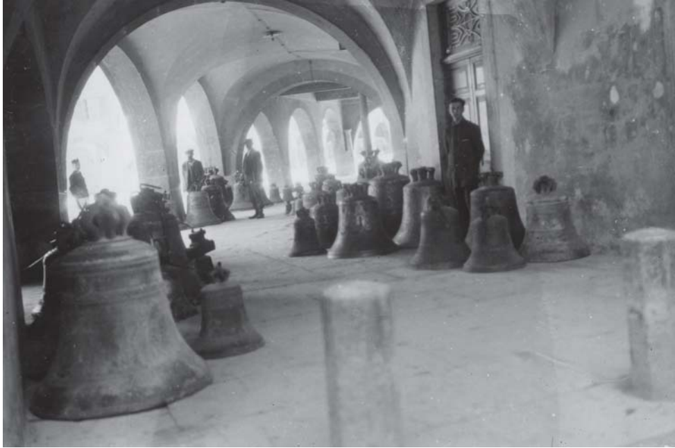
Riva del Garda. Le campane sotto il municipio [MGR 165/48]