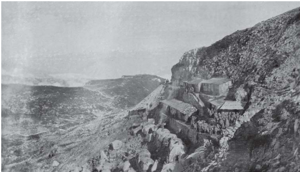
Monte Pasubio. Baraccamenti sul rovescio del Panettone medio e veduta della conca del Cosmagnon [MGR 62/66]