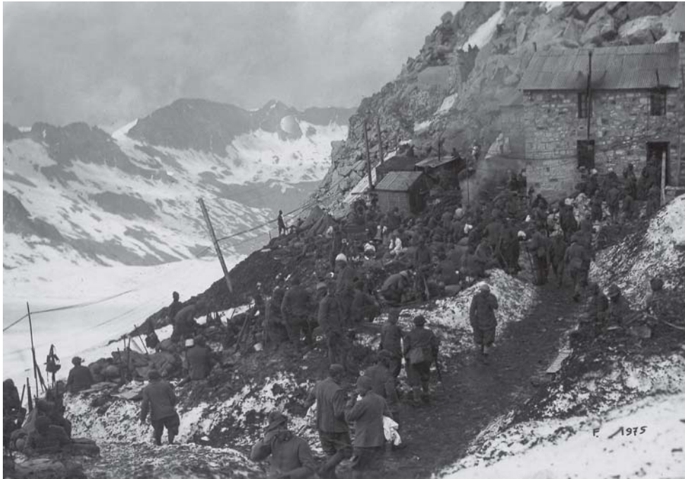
Adamello. Un alti di alpini in marcia verso Corno Cavento [MGR 7/2737]