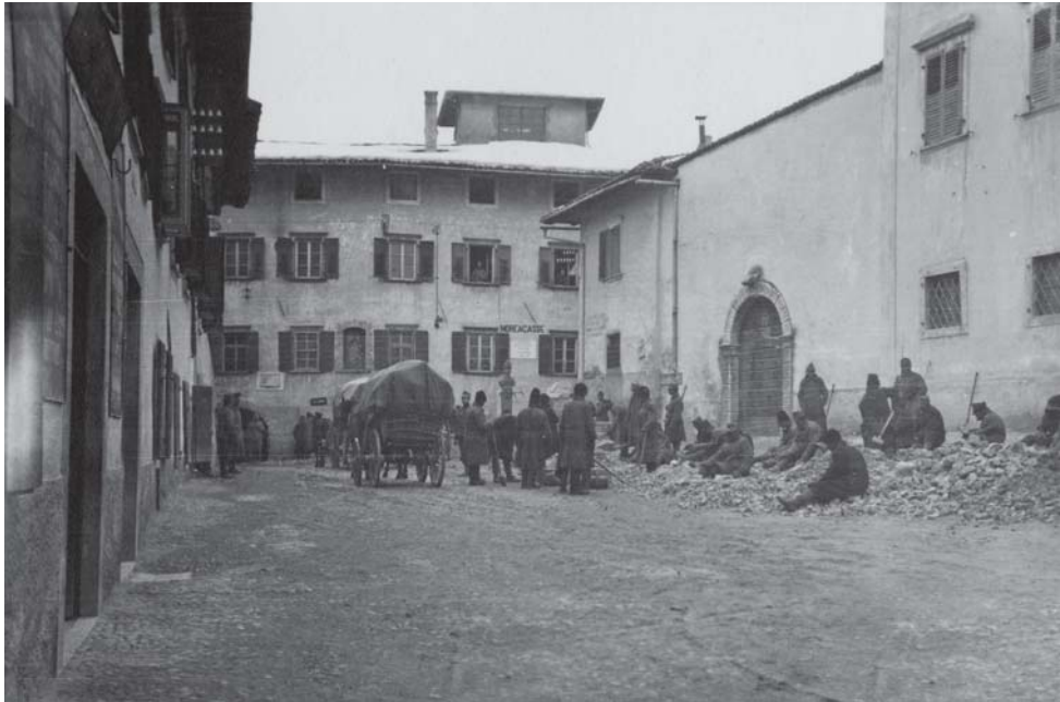
Villa Lagarina, piazza Italia. Prigionieri russi al lavoro [MGR 181/10]