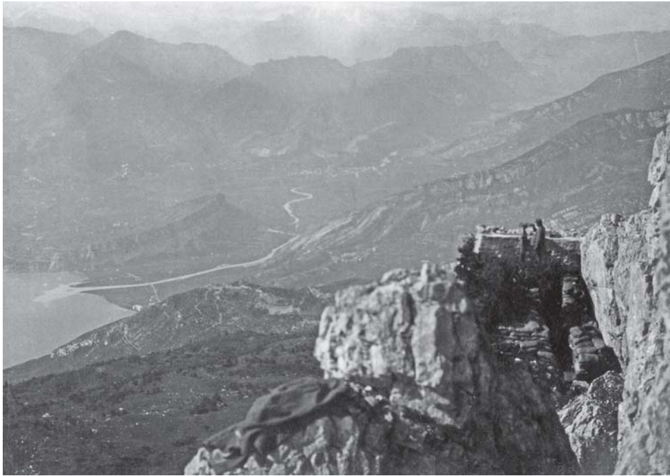
Altissimo. La Valle del Sarca e il Brione [MGR Fondo Tisato]