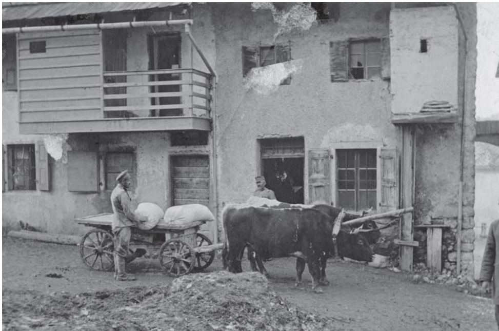
Folgaria. Deposito militare, prigionieri russi occupati nei trasporti viveri [MGR 168/93]