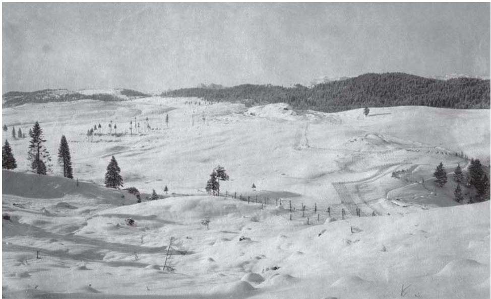
Reticolati della prima linea austriaca tra il passo Vezzena e il Basson [MGR 199/82]