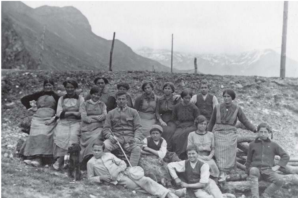
Chiusole, operaie militarizzate. 1917/04/15 [MGR 181/14]