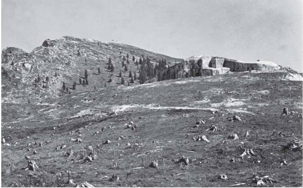
Altipiano di Lavarone. Forti Busa Verle e Pizzo Vezzena nel dopoguerra [MGR 129/127]