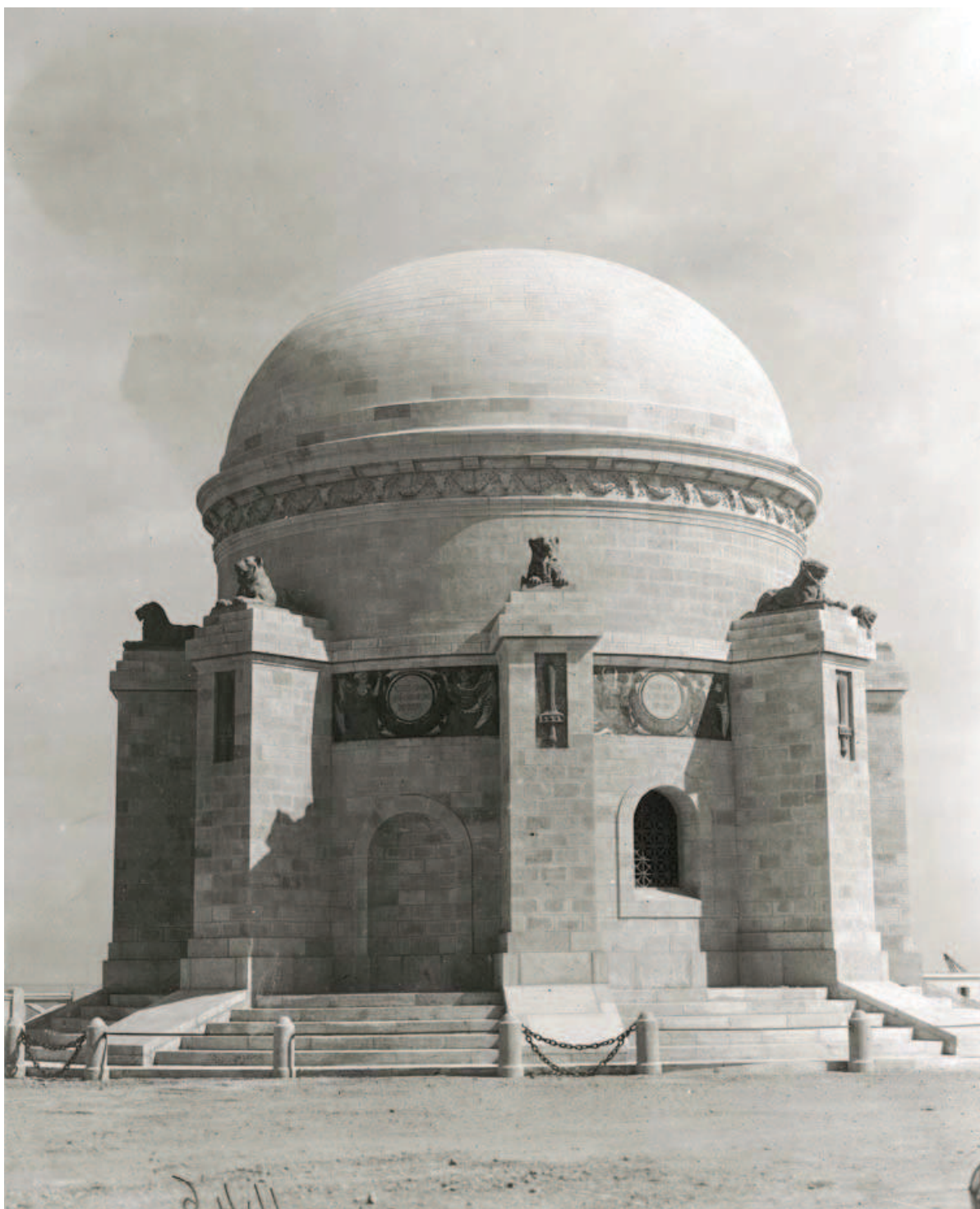
Fig. 5 - Tripoli, monumento ai caduti (1926) [MSIG, Archivio storico, Fondo Giuseppe Malladra, 1.05680].