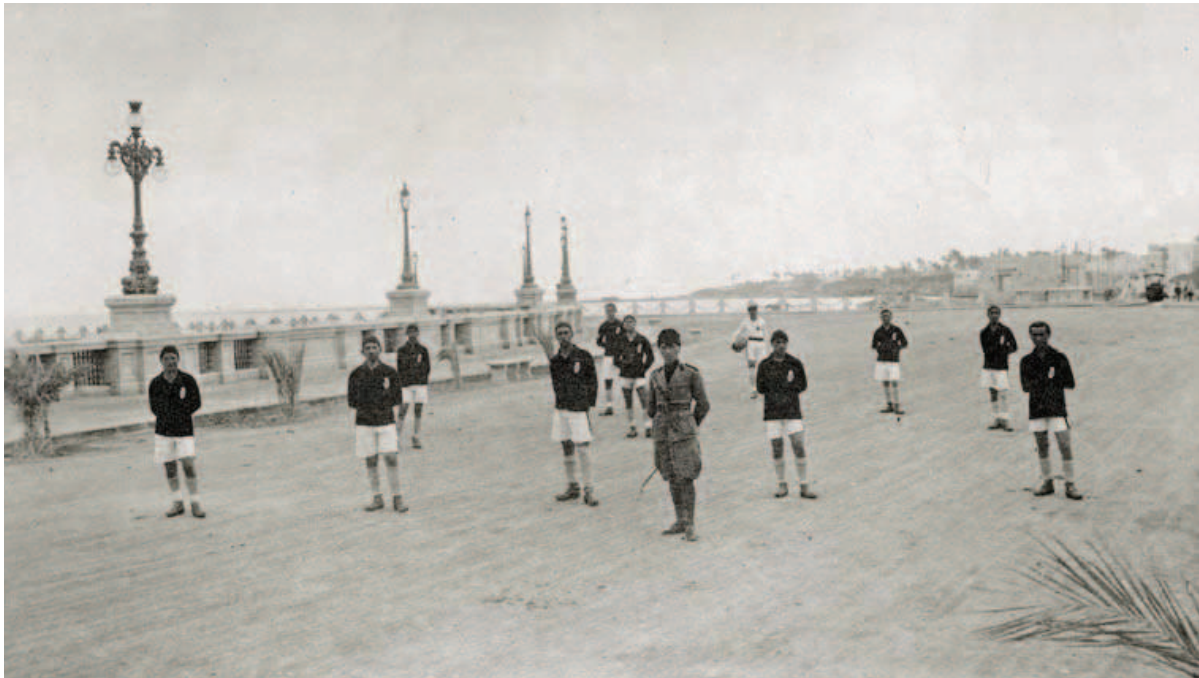
Fig. 6 - «La squadra di foot-ball della Legione schierata sul viale Conte Volpi, Tripoli» (1926) [MSIG, Archivio storico, Fondo Giuseppe Malladra, 1.05590].