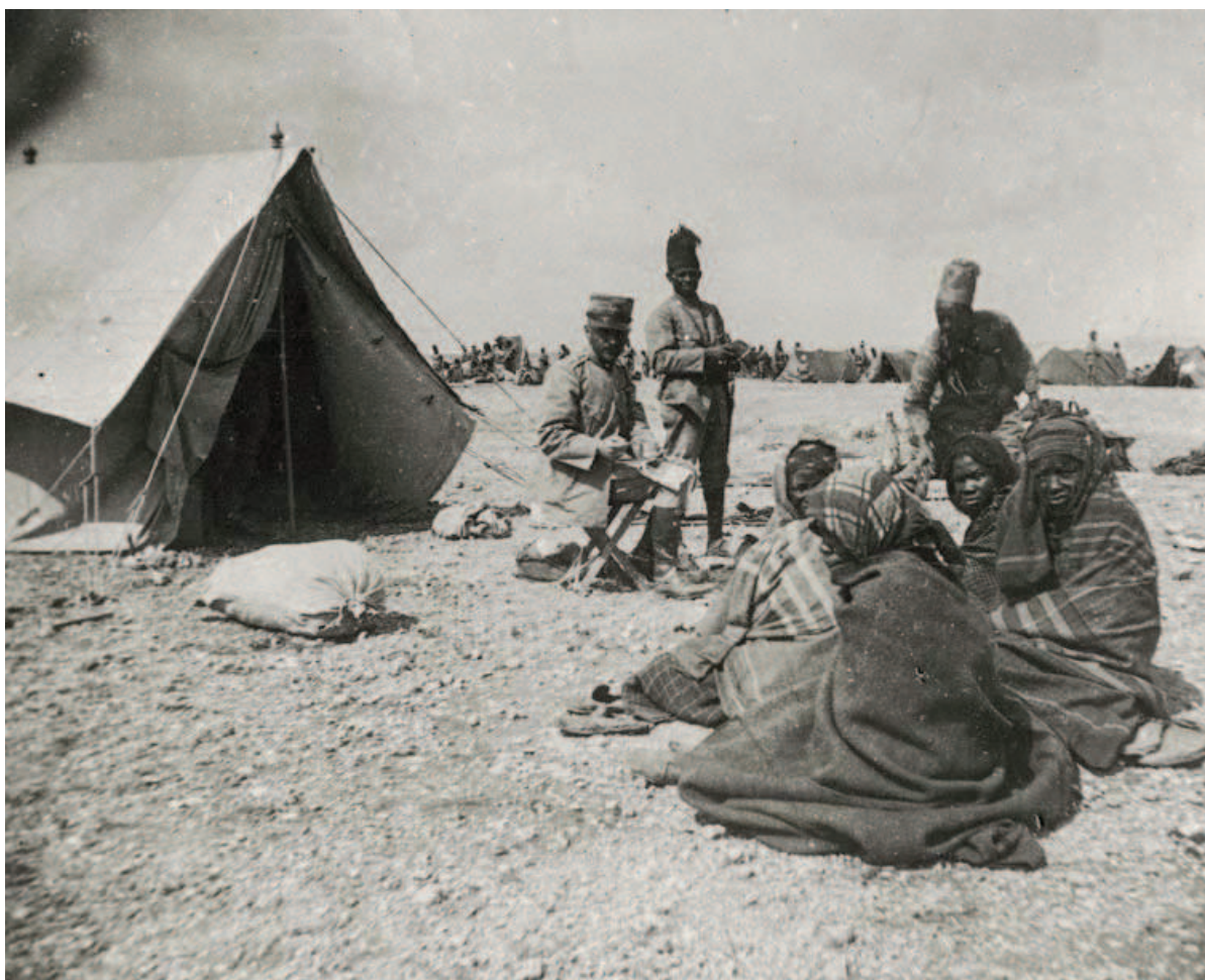
Fig. 3 - Operazioni in Cirenaica febbraio-aprile 1914, 1° battaglione Bendir.

poi lo sguardo dell'osservatore sulla destra dove, in primo piano, un gruppetto di quattro donne è seduto a terra. Indossano tutte il velo islamico che lascia scoperto solo il volto, due di loro sono girate verso l'obiettivo; la loro espressione e l'atteggiamento di chiusura del corpo suggerisce preoccupazione. In secondo piano, un po' sfuocato, si vede un ascaro chinato che sta compiendo un'azione non leggibile. Sullo sfondo è riconoscibile l'accampamento degli italiani, vi sono diverse tende e uomini che occupano la linea dell'orizzonte. L'inquadratura della scena è molto ampia, la scelta del fotografo di posizionarsi leggermente più in basso dei personaggi offre allo spettatore una veduta generale. I carteggi tenuti in mano da Malladra e il libriccino dell'ascaro suggeriscono che stiano tentando di parlare con il gruppo di donne, probabilmente cercando di tradurre dall'italiano alcune frasi. Dal registro delle donazioni risulta che Malladra abbia regalato diversi dizionari e manuali di lingua abissina, tigrina e di grammatica elementare della lingua amarina; effettivamente una delle difficoltà