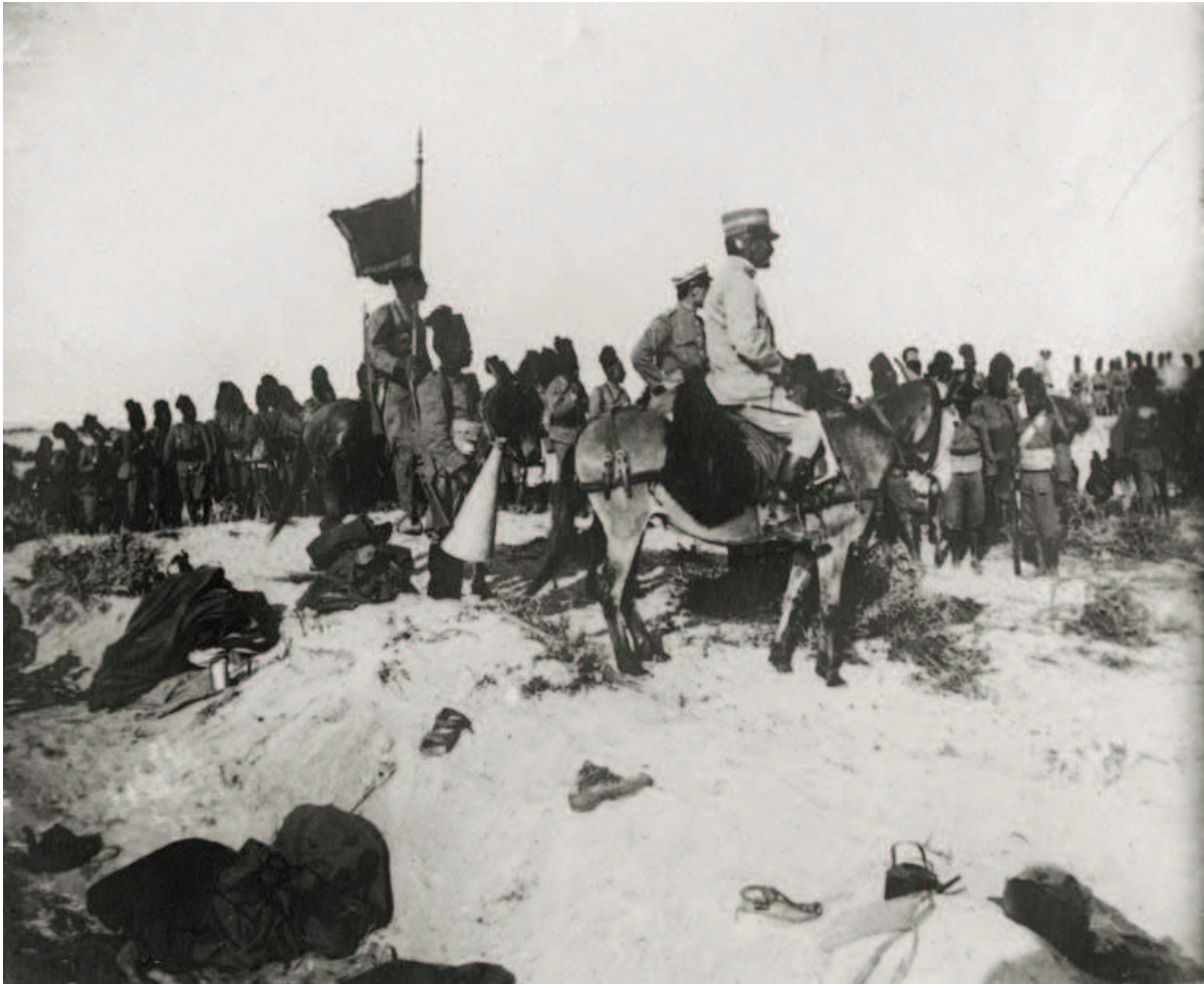
Fig. 2 - Operazioni in Cirenaica febbraio-aprile 1914, 1° battaglione Bendir.