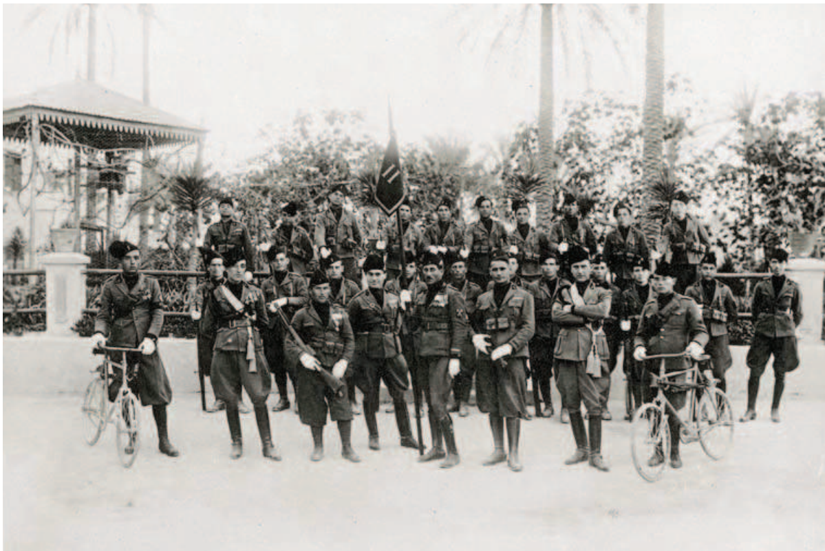
Fig. 7 - «Stato Maggiore della II Coorte alla caserma Pietro Verri, Tripoli» (1926).