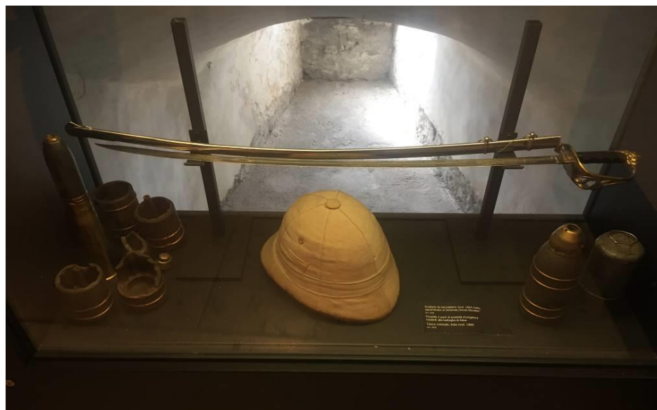
Fig. 6. La spada di Baratieri, parti di artiglieria provenienti da Adua e un casco coloniale, oggi in esposizione presso il Museo della Guerra.