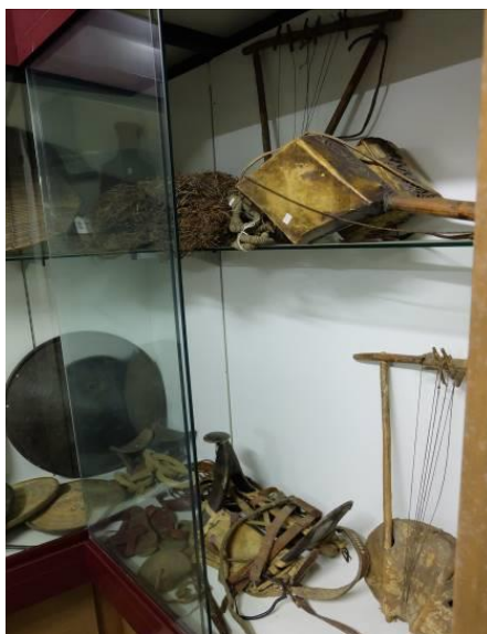
Figg. 4, 5. Le vetrine dei magazzini del Museo della Guerra dove sono conservate le collezioni coloniali.