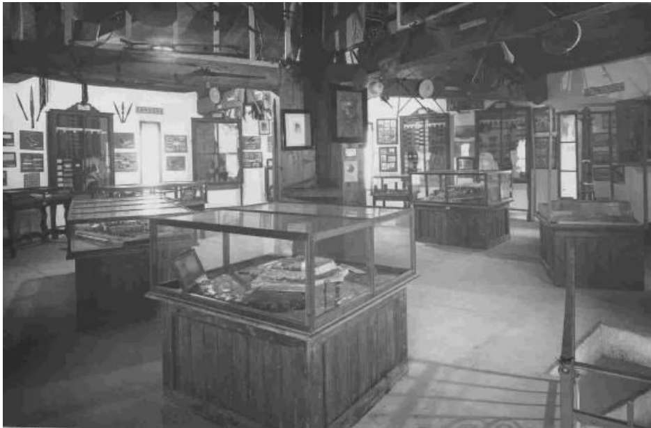
Figg. 2, 3. Due vedute delle sale coloniali del Museo della Guerra nel 1929: si distinguono nitidamente il plastico del faro di Tripoli, le fasce colorate dei reparti libici, numerose fotografie alle pareti e lance e scudi africani alle travi del soffitto (MSIG, AF, 300/17 e 127/47).