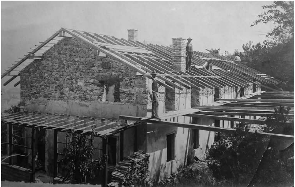
La casa della famiglia Chiesa in viale Zugna in ricostruzione dopo la guerra.