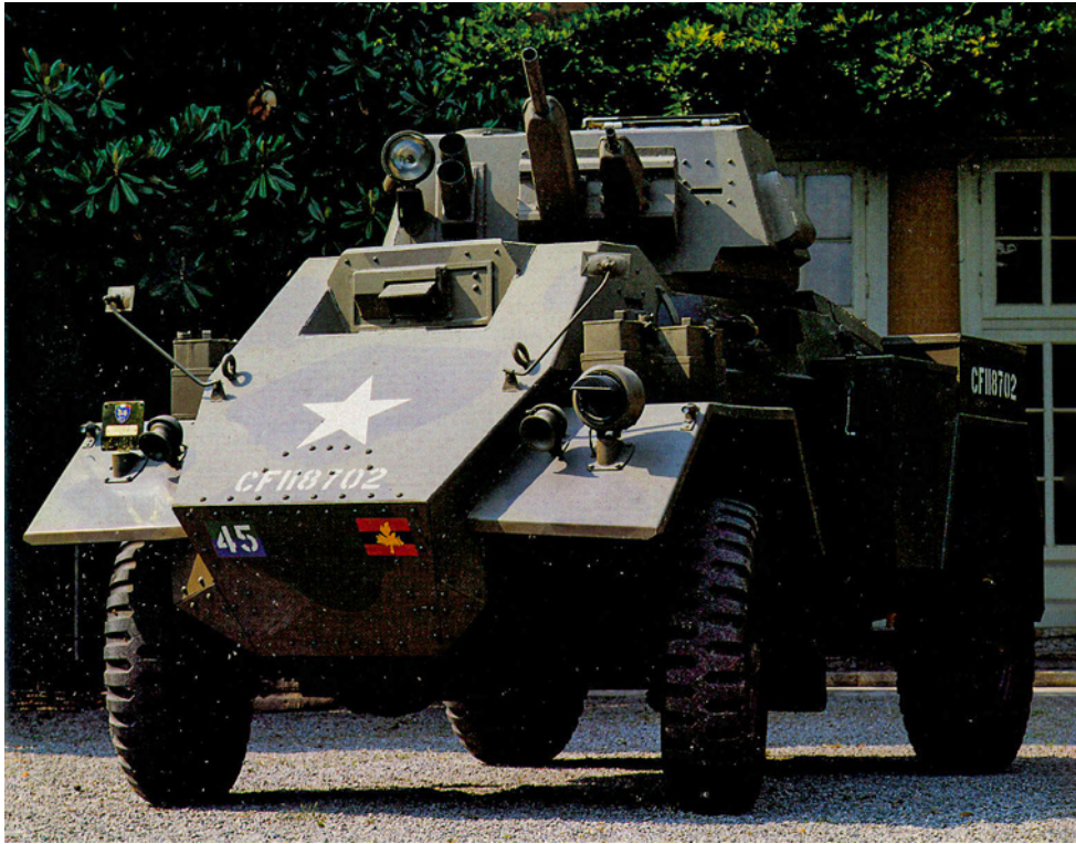
L'autoblindo FOX di produzione canadese (inv. VM040).

precedenti segni identificativi nazionali. La 1 a Armata canadese diramò un ordine in tal senso l'11 aprile 1944.