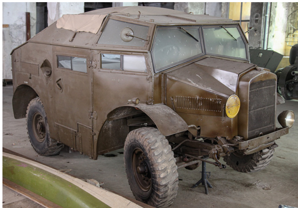
Trattore d'artiglieria inglese Morris Commercial C8 Field Artillery Tractor (inv. VM029).

Il carrello porta-munizioni, che serviva anche da avantreno, è il noto Trailer Artillery , n. 27, utilizzato principalmente in accoppiata con l'obice-cannone da 25 libbre, del quale poteva trasportare 32 proietti, riposti in due scomparti, oltre che attrezzi e parti di ricambio del pezzo; ogni sezione d'artiglieria aveva inoltre assegnato un Morris C8 FAT con due carrelli al traino, con ulteriore munizionamento. Non mancano, tuttavia, evidenze fotografiche dell'uso dell'avantreno in accoppiata con il cannone controcarri da 17 libbre. Il carrello reca una targa che riporta il tipo di materiale, " Trailer Artillery C No 27 Mark I/L ", il produttore, "F. & W. Co Ltd", e il probabile anno di produzione, "1943"; seguono un numero di matricola, "REG No 28676" e, presumibilmente, il numero di registrazione del brevetto, "PAT Nos 471789".