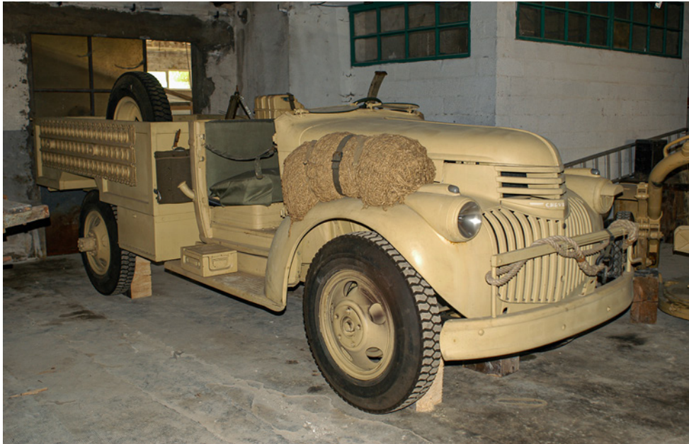
L'autocarro inglese Humber Chevrolet 1533X2 4X2 30 CWT (inv. VM037).

per favorire il raffreddamento dei motori. Il cassone di tipo Gotfredson 4BI aveva il pavimento in acciaio e sponde laterali in legno, caratterizzato dalla presenza di numerosi contenitori chiusi. I piantoni su cui erano montate le sponde fungevano anche da supporti per le armi di bordo mentre un ulteriore supporto per mitragliatrice era fissato alla parte posteriore del pavimento del cassone e un'ultima arma poteva essere fissata sul supporto montato a sinistra della cabina, sul lato del passeggero. Armi individuali potevano essere fissate con delle cinghie ai lati dei sedili del guidatore e del passeggero. All'esterno del cassone, sopra le ruote posteriori, venivano montate le speciali griglie per il disinsabbiamento, mentre un po' ovunque trovavano posto numerose taniche per il carburante di riserva.