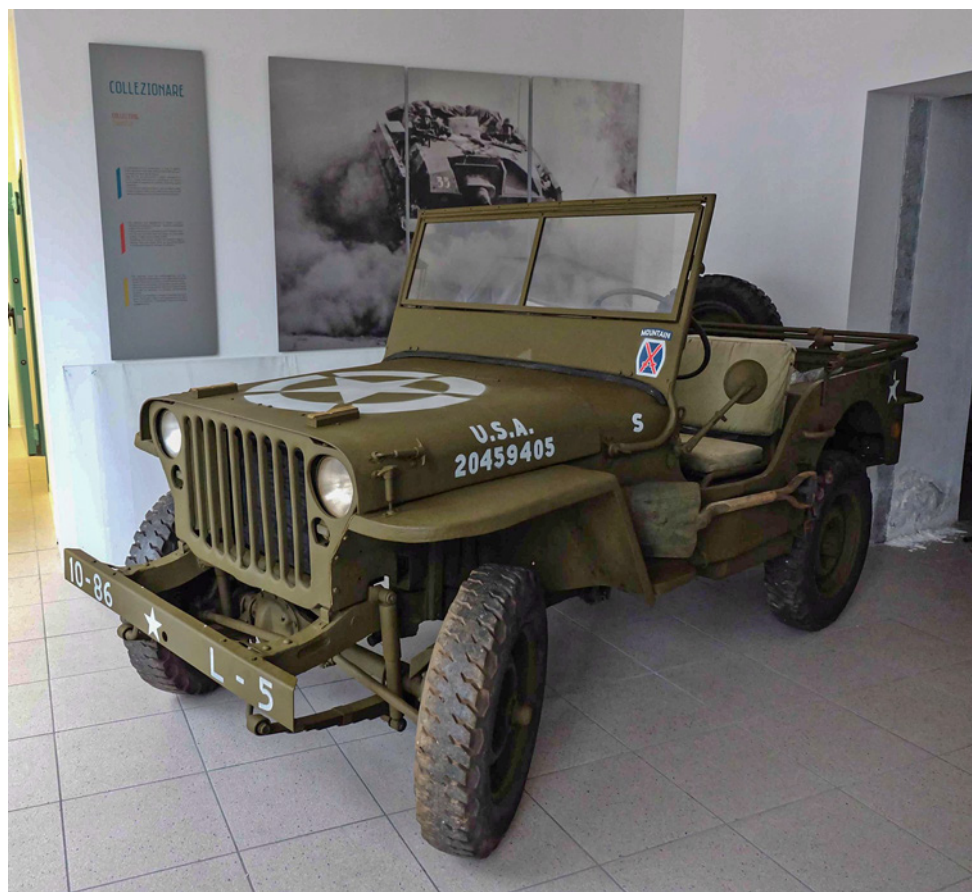
La Jeep MB con allestimento 10 th Mountain Division esposta presso l'ex Colonia Pavese di Torbole sul Garda (inv. VM060).

Il motore era il Willys 442, noto tra i soldati con il nomignolo di go devil per la sua estrema affidabilità, un 4 cilindri in linea alimentato a benzina e raffreddato ad acqua, di 2.196 cc. capace di raggiungere i 97 km/h.