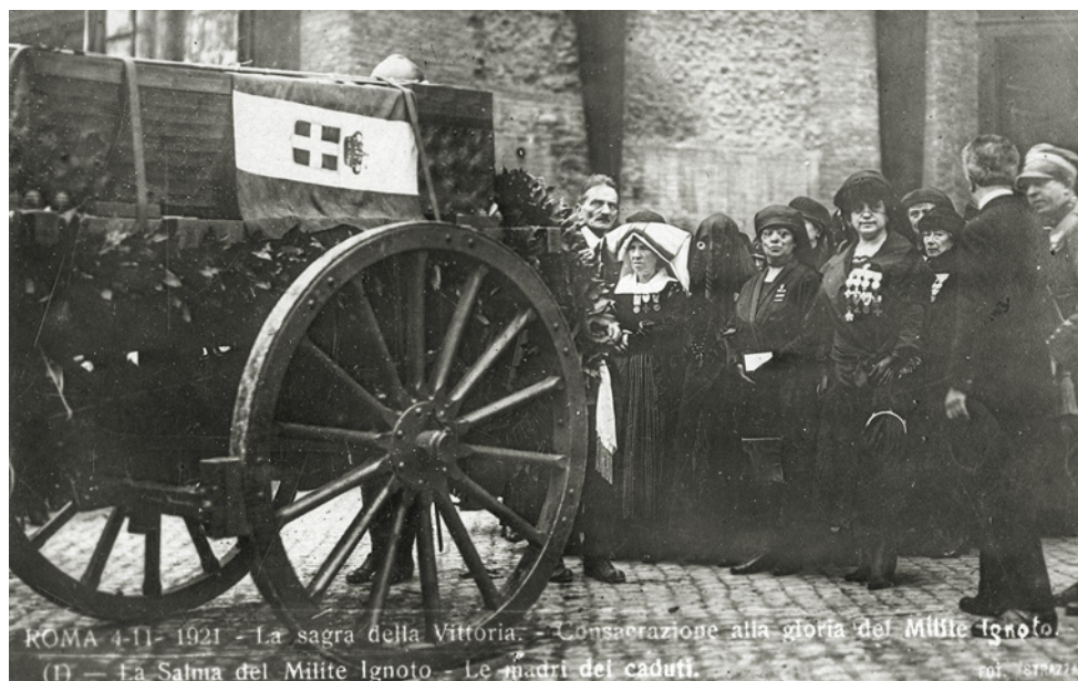
Cartolina commemorativa della cerimonia di traslazione della salma del milite ignoto al Vittoriano, 4 novembre 1921. MSIG, AS, fondo famiglia Chiesa , 2.4.6.