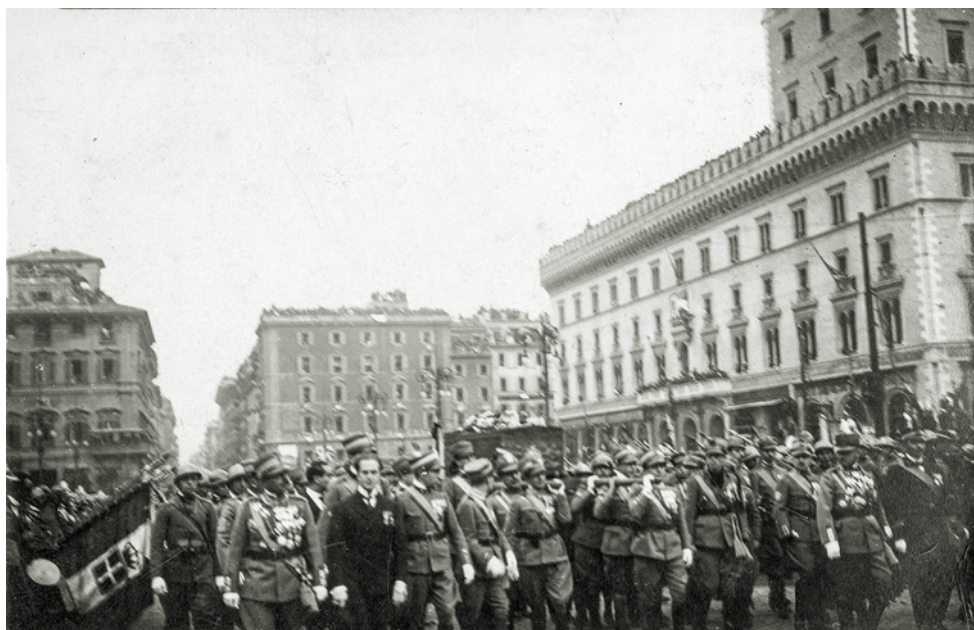
Trasporto della salma del milite ignoto al Vittoriano. MSIG, AS, fondo famiglia Chiesa , 2.4.6.