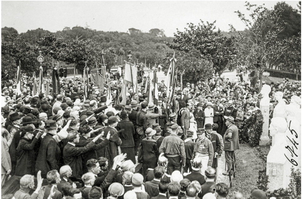
Inaugurazione del busto dei martiri roveretani sul Pincio, 27 giugno 1926. MSIG, AS, fondo famiglia Chiesa , 2.4.6.

Fu in questo periodo che l'allora colonnello venne eletto presidente del Museo, per il quale si impegnò in modo sostanziale al fine di ottenere dal Ministero della Difesa 28 pezzi d'artiglieria e consentire così la creazione del "parco delle artiglierie" nel fossato del castello; giocò inoltre un ruolo di primo piano anche nell'allestimento della sala Caproni (1949) e nell'elaborazione del nuovo statuto del Museo, approvato nel 1950.